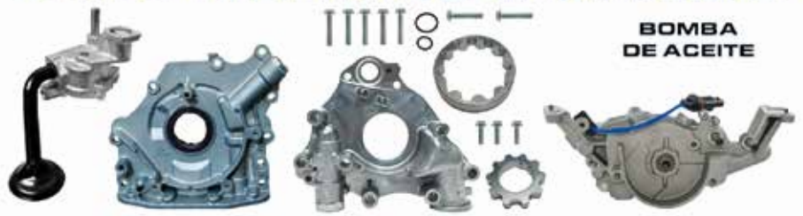
BOMBA DE ACEITE

DYNAGEAR DE MEXICO S.A. DE C.V. CENTRO DE DISTRIBUCION QUERETARO